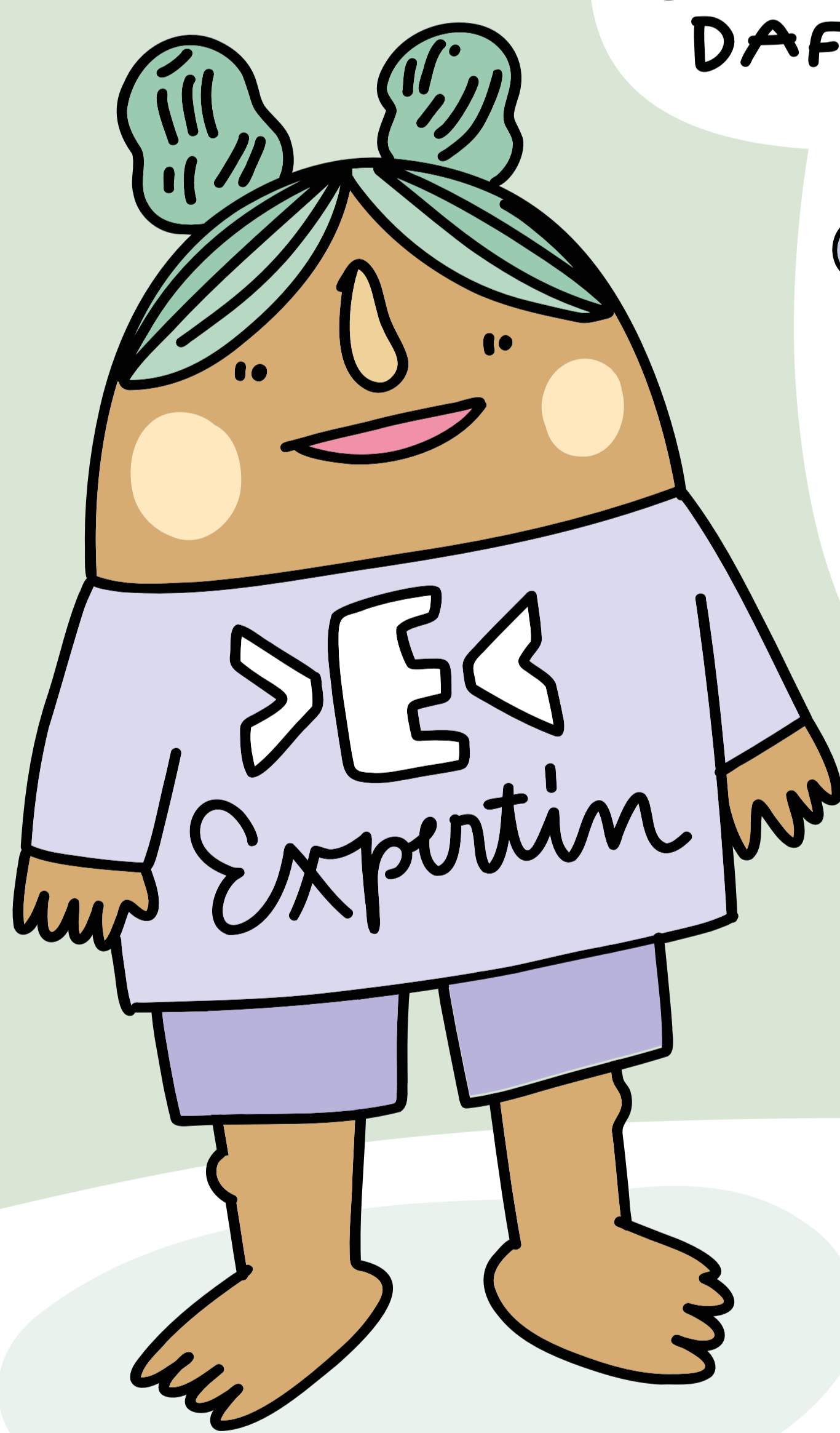
Illustration von SUSANNE ASHEUER